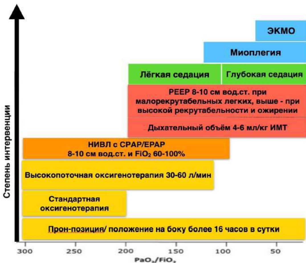
Схема 1. Пошаговый подход в выборе респираторной терапии COVID-19

Для начала прекращения респираторной поддержки обязательно наличие всех основных респираторных и общих критериев готовности к прекращению респираторной поддержки.